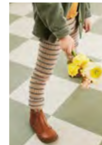
PAULS PERLERIBBUKSE Sunday Design 1