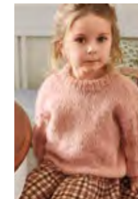
ELSA GENSER Børstet alpakka Tynn silk mohair Design 5