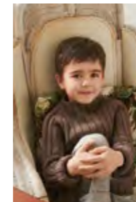
PETERS DOBBEL RIBBGENSER Sunday x2 Design 4