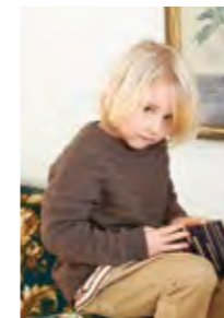
ALFREDS RILLEGENSER Tynn merinoull Design 7