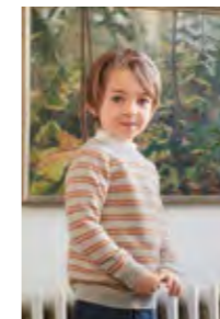
SIMPELTHEN STRIPEGENSER Sunday Design 8