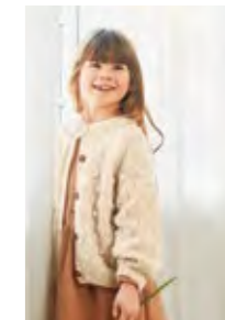
POPCORN JAKKE Børstet alpakka Tynn silk mohair Design 6