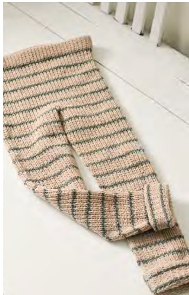
2103 | SUNDAY | 3 | 28 | 110 | PAULS PERLERIBB BUKSE 1 | 2-8 ÅR (ovenfra og ned)