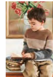
BILLYS STRIPEGENSER Kos Design 3