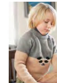
PANDAGENSER Merinoull Design 11