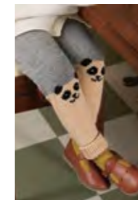
PANDABUKSE Merinoull Design 9