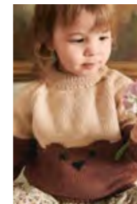
BJØRNEGENSER Merinoull Design 10