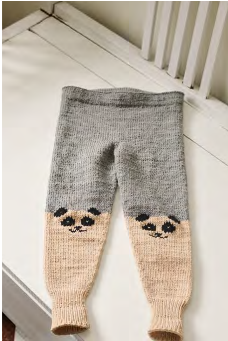
2103 | MERINOULL | 3\frac{1}{2} | \frac{22}{10} | •• PANDABUKSE 9 | 2-8 år (ovenfra og ned)